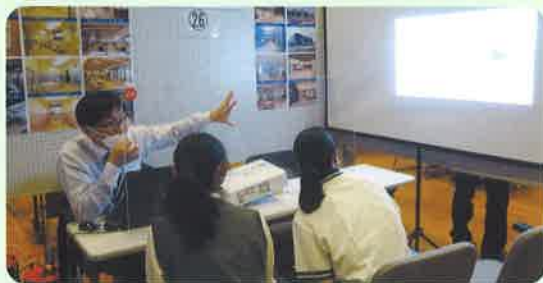
西条市就職セミナー