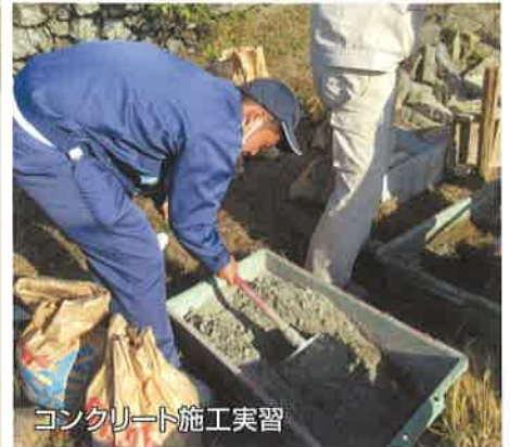
コンクリート施工実習