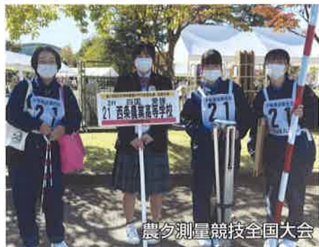
農夕測量競技全国大会