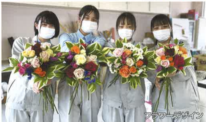
フラワーデザイン