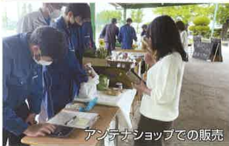
アンテナショップでの販売