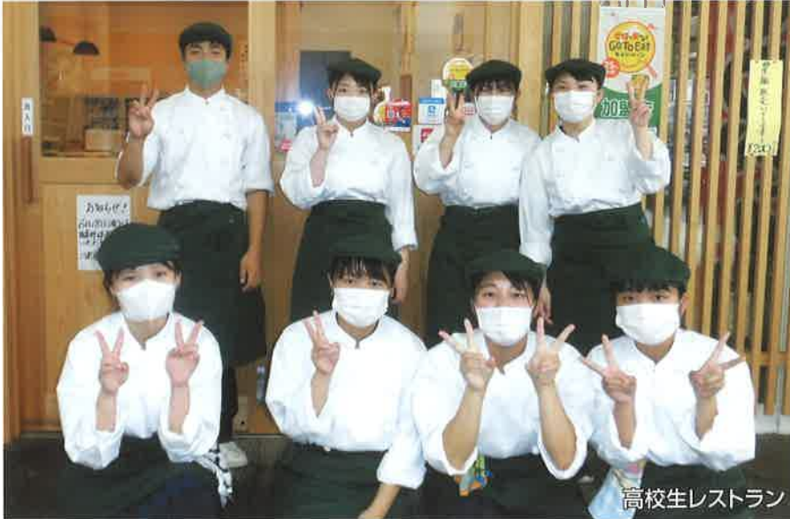
高校生レストラン

野菜を栽培して、調理・加工だけでなく、販売実習や高校生レストランなどで販売、提供することができるので、一次産業～三次産業まで全てを学ぶことができます。多肉植物の栽培やフラワーデザインなど園芸科目の学習や調理、被服(和裁・洋裁)などの家庭科目などを自分の進路目標にあわせて学習・資格の取得を目指します。