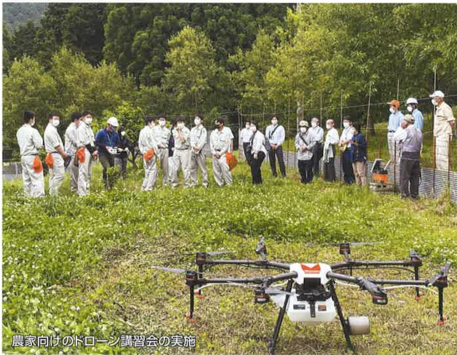
農家向けのドローン講習会の実施