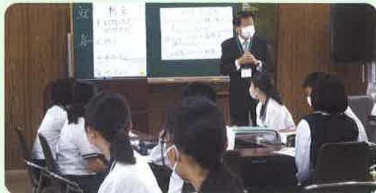
就職セミナーによるキャリア教育