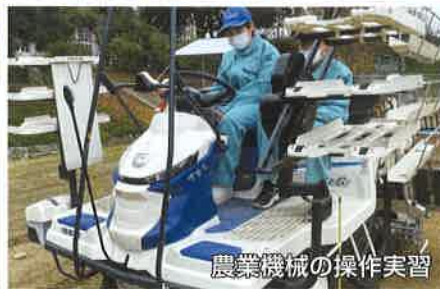
農業機械の操作実習