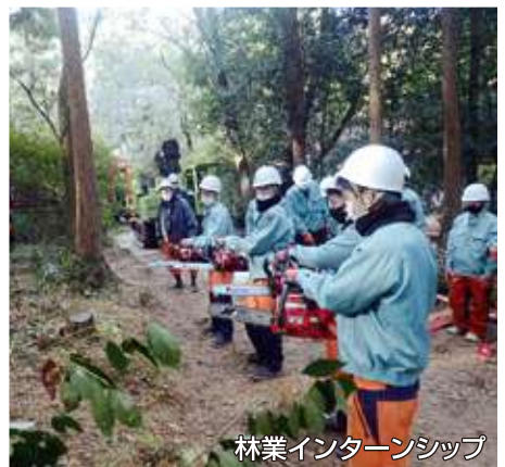
林業インターンシップ