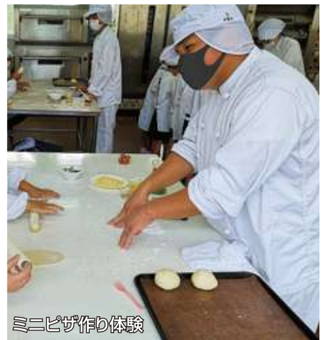
ミニピザ作り体験