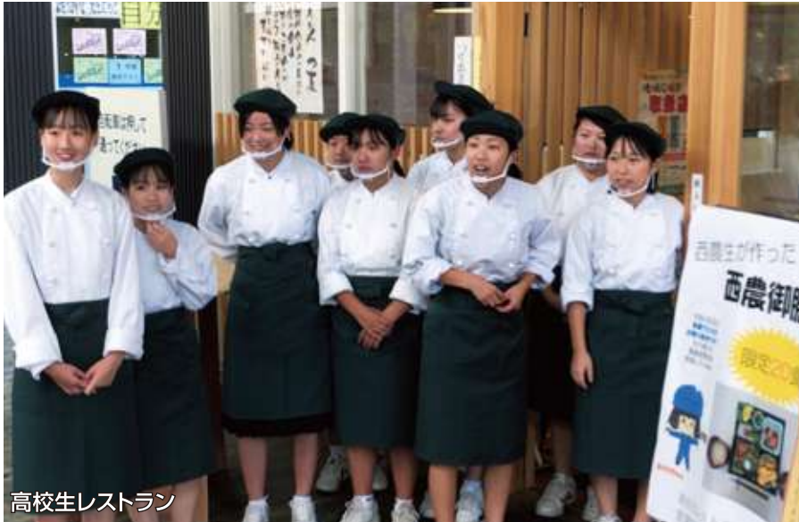
高校生レストラン

野菜を栽培して、調理・加工だけでなく、販売実習や高校生レストランなどで販売、提供することができるので、一次産業～三次産業まで全てを学ぶことができます。多肉植物の栽培やフラワーデザインなど園芸科目の学習や調理、被服（和裁・洋裁）などの家庭科目などを自分の進路目標にあわせて学習・資格の取得を目指します。