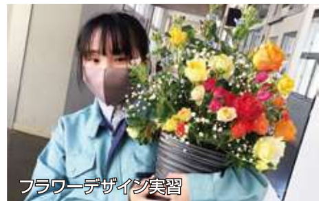
フラワーデザイン実習