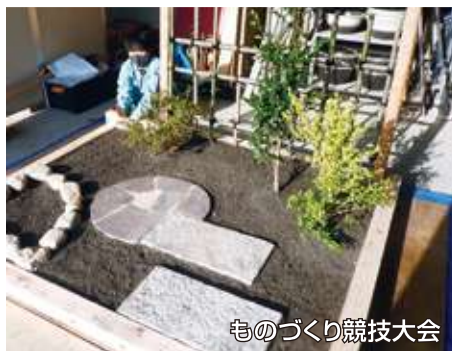
ものづくり競技大会