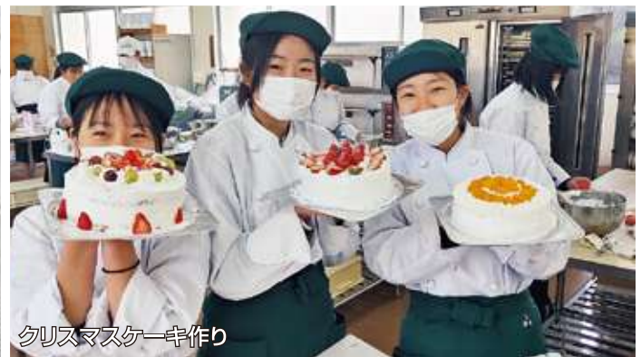
クリスマスケーキ作り