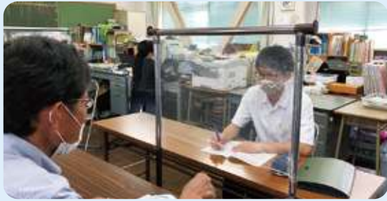
チューター制度による個別指導