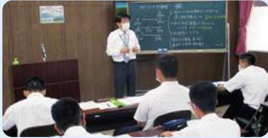
進路セミナーによるキャリア教育