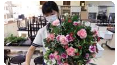
フラワー装飾技能士